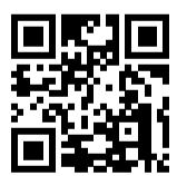
Ersatzhaltestelle Richtung Lauda