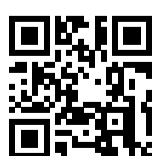
Ersatzhaltestelle Richtung Würzburg